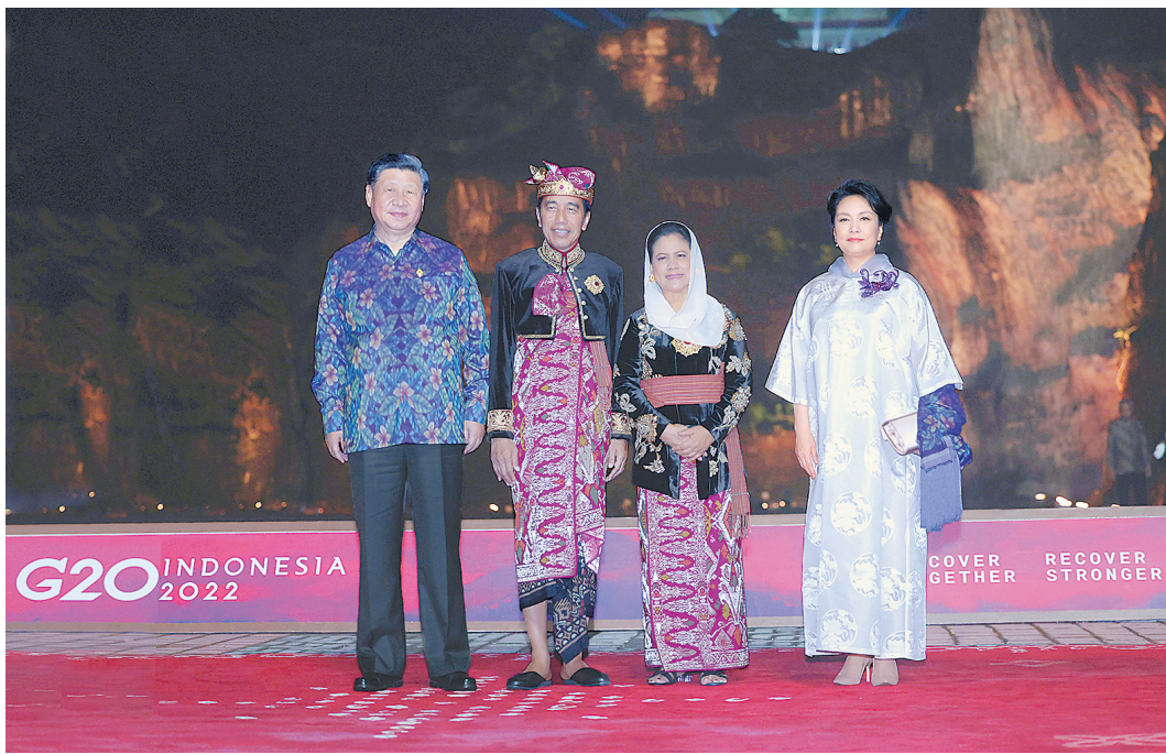
当地时间11月15日晚,国家主席习近平和夫人彭丽媛在印度尼西亚巴厘岛出席二十国集团领导人峰会欢迎晚宴。这是习近平主席夫妇在晚宴前同印度尼西亚总统佐科夫妇合影。