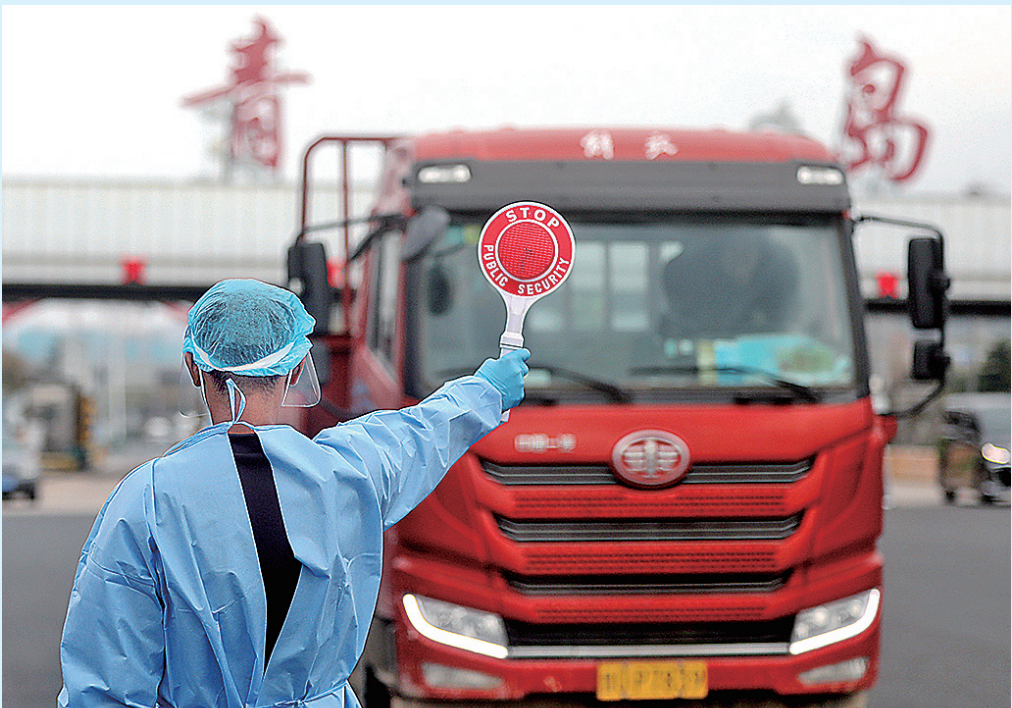
■在青银高速青岛东出入口，工作人员正在检查过往车辆。