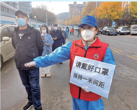
■李沧区惠水书院社区居民自发组成志愿团队，参与疫情防控。