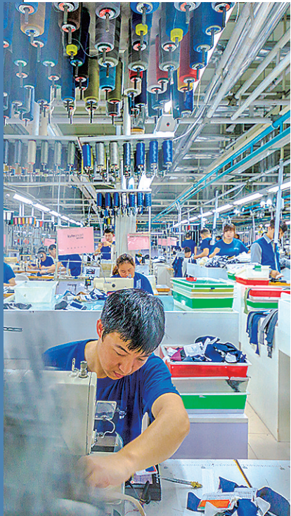
“酷特智能”个性化定制生产线。