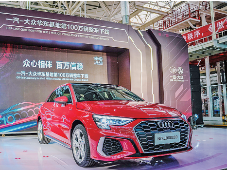
一汽大众华东基地第100万辆整车下线。