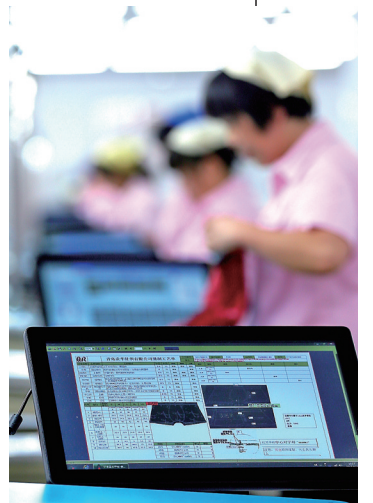
即发集团智能信息平台RFID车间产品检验终端。