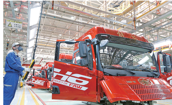
一汽解放总装生产线。