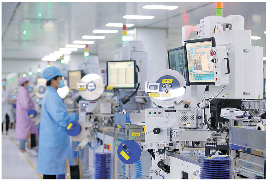
泰睿思微电子生产车间。