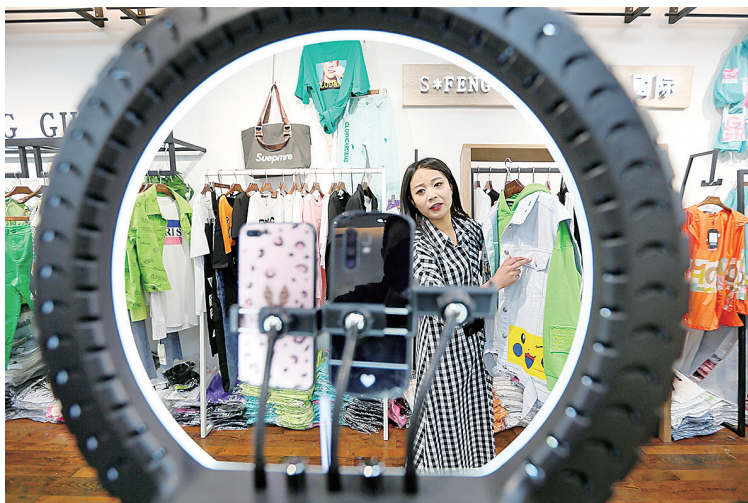
即墨服装批发市场,根禾服饰销售员在直播销售。