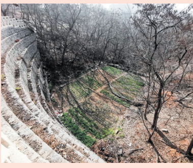
▲北岭山公园整治提升前