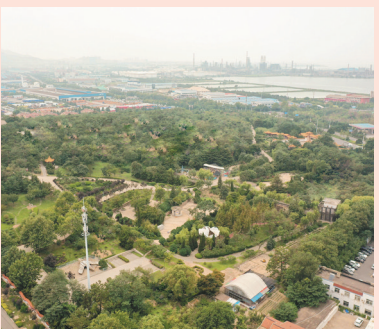
▲北海公园整治提升前