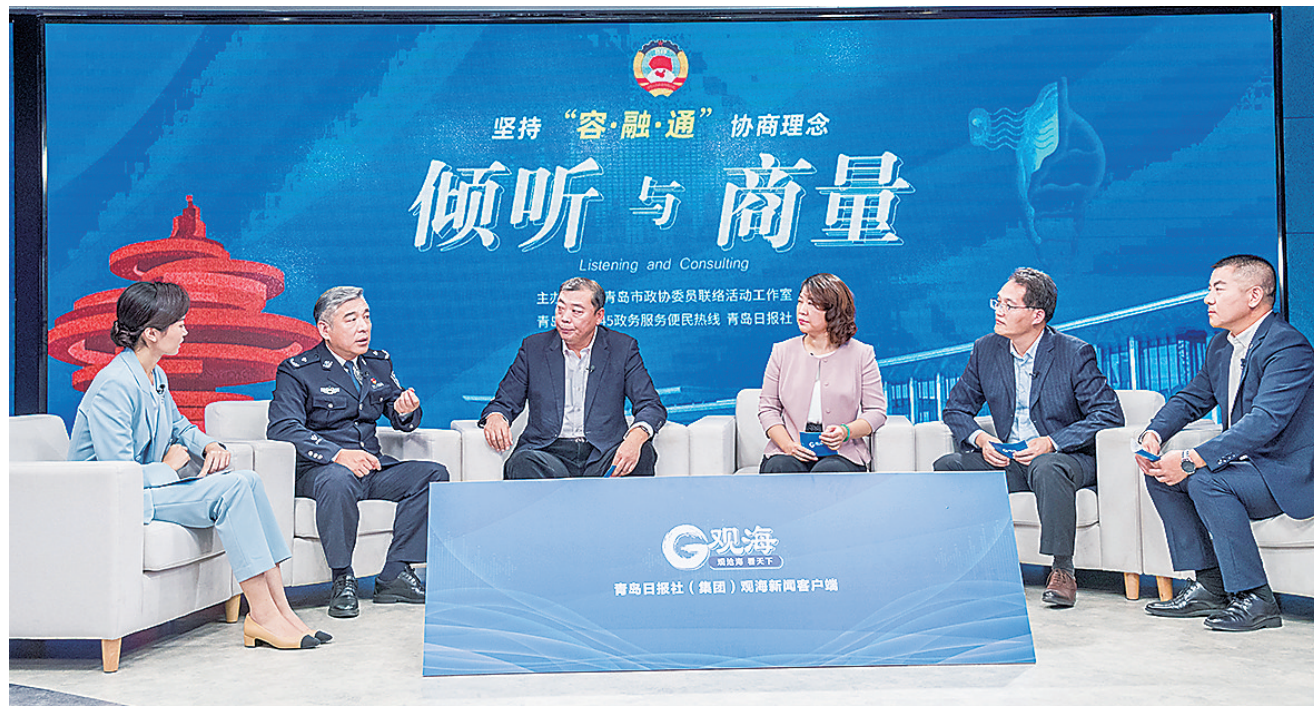
“倾听与商量”第19期协商活动现场。