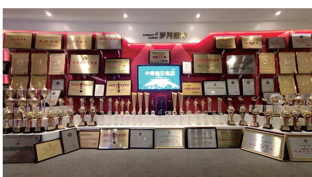
■中青建安集团荣誉展厅

下一个十年,中青建安人将勇敢践行新时代新征程使命任务的先锋,以更加强大的前进动力、更加昂扬的奋斗精神、更加坚定的必胜信念,全面贯彻新发展理念,服务构建新发展格局,加快实施创新驱动发展战略,坚持推动企业高质量发展,在建功新时代“筑”力新征程的康庄大道上赓续奋进。