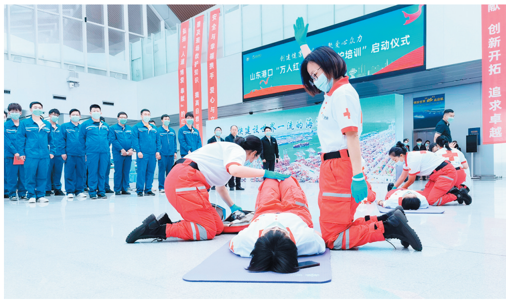
■青岛红十字救援队员在山东港口青岛港举行救援培训。

功率,是衡量城市国际化水平的重要指标。到2026年,青岛将新增持证红十字应急救援救护员6万人以上,接受救护员培训的中小学教职员师生比例不少于1:50,新增应急救援知识普及人数100万以上。青岛新建应急救援培训基地10个,对有需求的4A级以上景区援建红十字救护站,实现