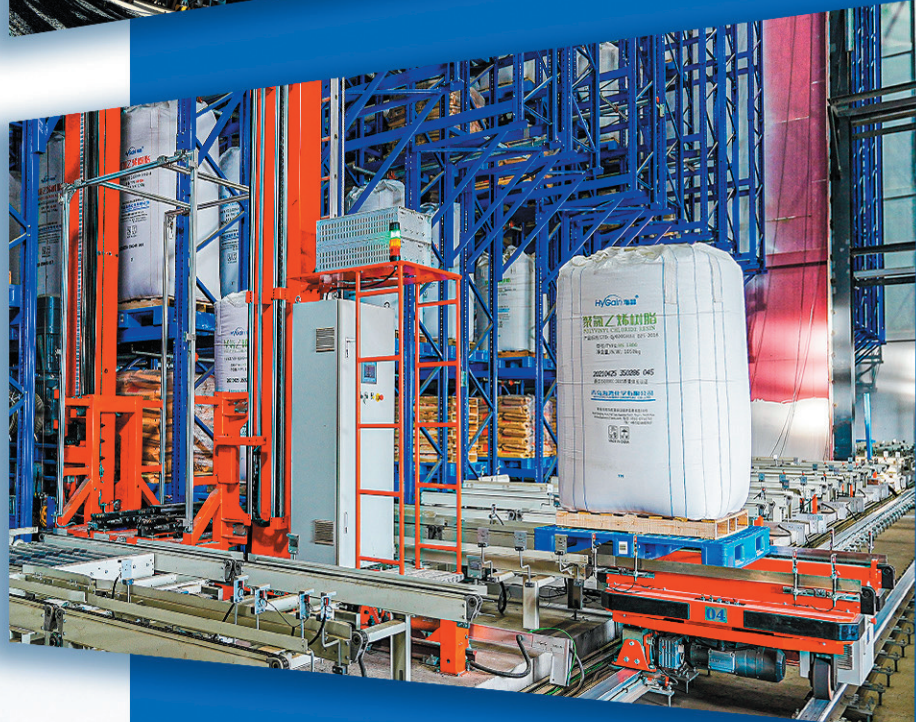
■海湾化学国内乙烯法聚氯乙烯最大智能立体仓库。