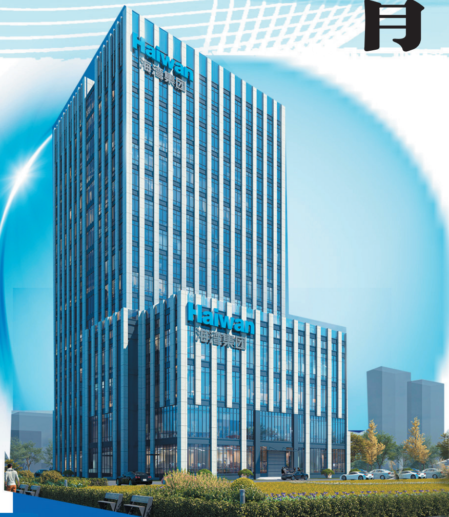
■青岛海湾集团在建的研发大楼。

过去十年，青岛海湾集团将基层党组织打造成凝聚党员群众的“主心骨”和企业发展的“领头羊”。面向未来，意气风发的海湾集团正在努力奔向下一个十年。