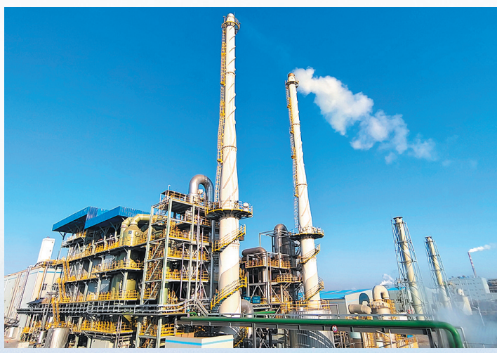
■海湾新材料医疗和危废协同处置线。