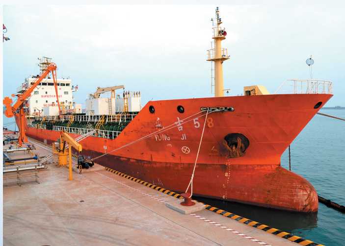
■青岛海湾集团董家口化工产业园区液化码头。

十年后，脚踏实地的海湾人将梦想的坐标点再度抬高，打造世界一流化工企业。下一个十年，仍将是海湾人开疆辟土、波澜壮阔的新十年。