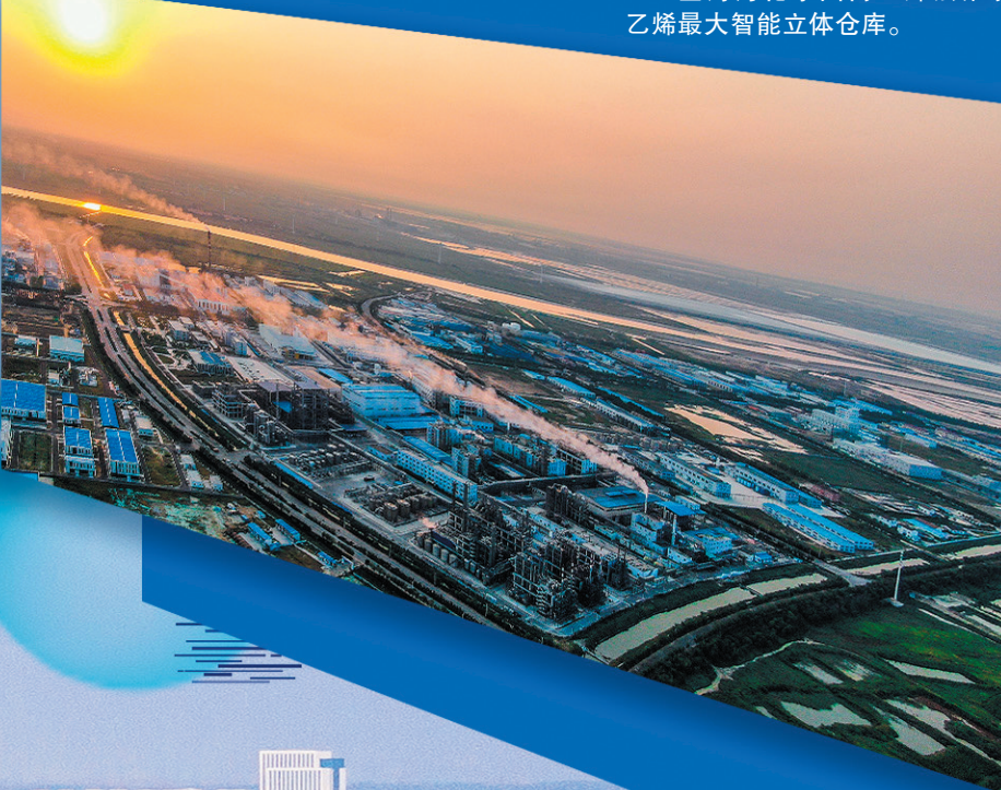
■青岛海湾集团新河化工产业园区。