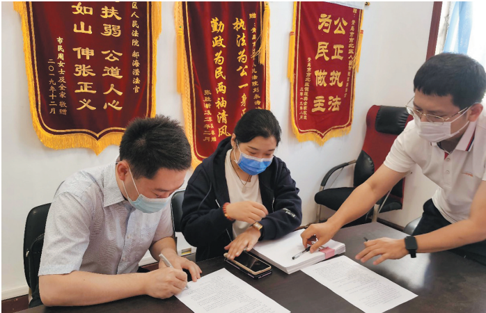
▶经市北区法院调解，一起行政案件双方当事人签署调解协议。