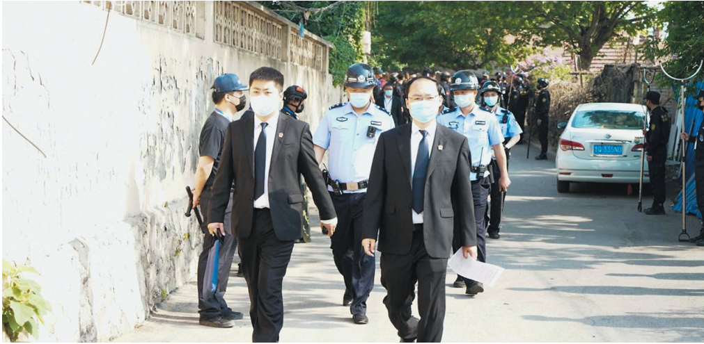
▲市北法院法官为闫家山改造项目涉迁当事人送达法律文书。

青岛市市北区人民法院始终坚持以习近平新时代中国特色社会主义思想为指导，紧紧围绕“努力让人民群众在每一个司法案件中感受到公平正义”的目标，聚焦“作风能力提升年”工作主题，深入推进“转作风、强能力、抓落实、促提升”，全面推动审判执行各项工作高水平开展，努力为全区经济社会高质量发展提供有力的司法服务保障。