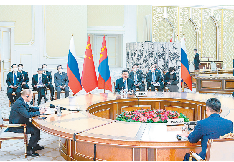
当地时间9月15日下午，国家主席习近平在撒马尔罕国宾馆同俄罗斯总统普京、蒙古国总统呼日勒苏赫举行中俄蒙三国元首第六次会晤。