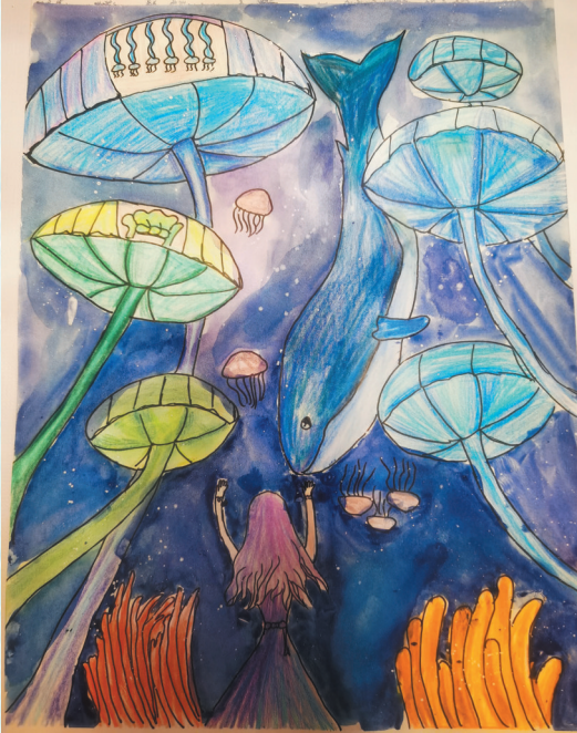
■《拥抱海洋 感恩海洋 善待海洋》 青岛市实验小学六年级 武祺菲