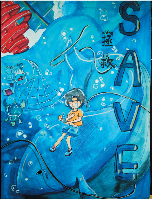
■《拯救》 青岛第二十六中学九年级 林冠瞳