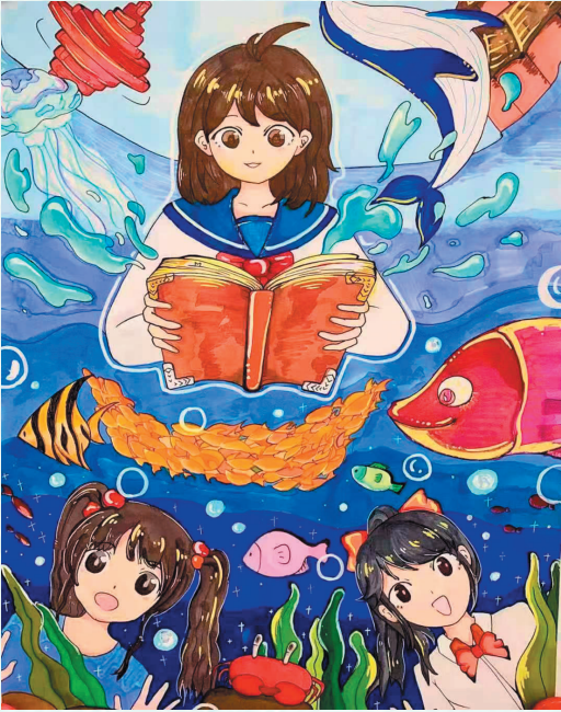
■《海底探秘》 青岛超银中学(广饶路校区)2020级 李欣宜