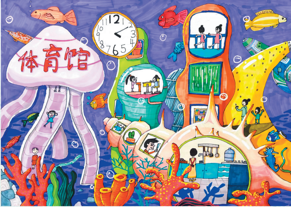
■《仿生海底城》 李沧区实验小学四年级 谢雨霏