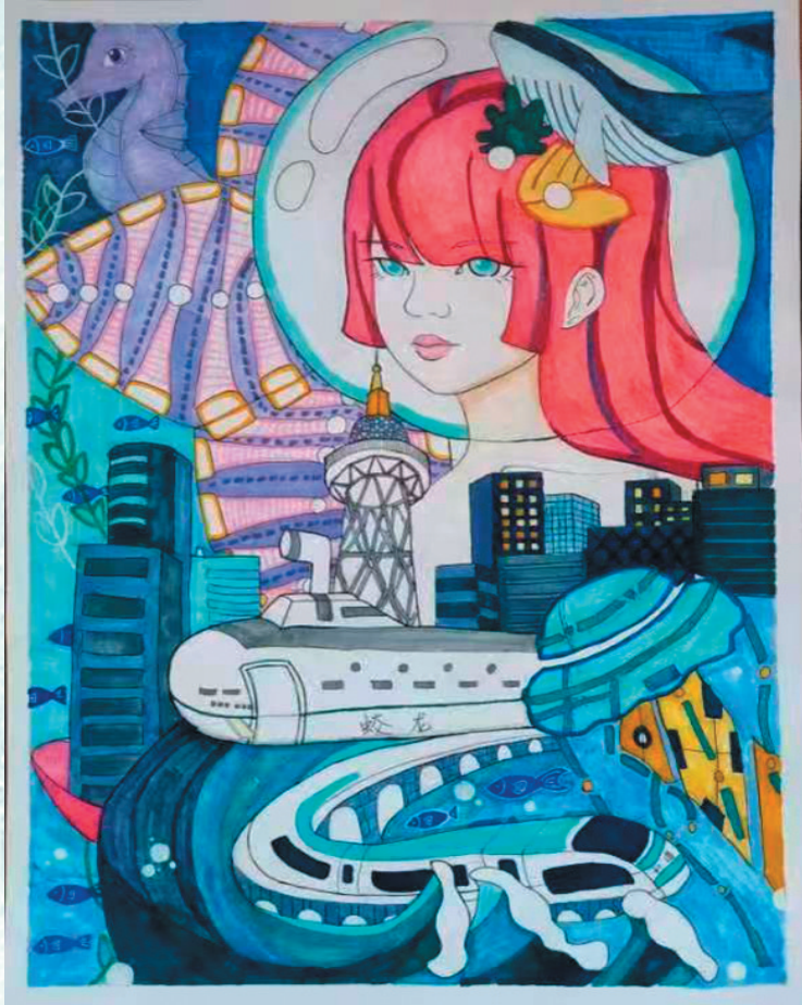
■《蔚蓝》 青岛第二实验初级中学八年级 李佳睿