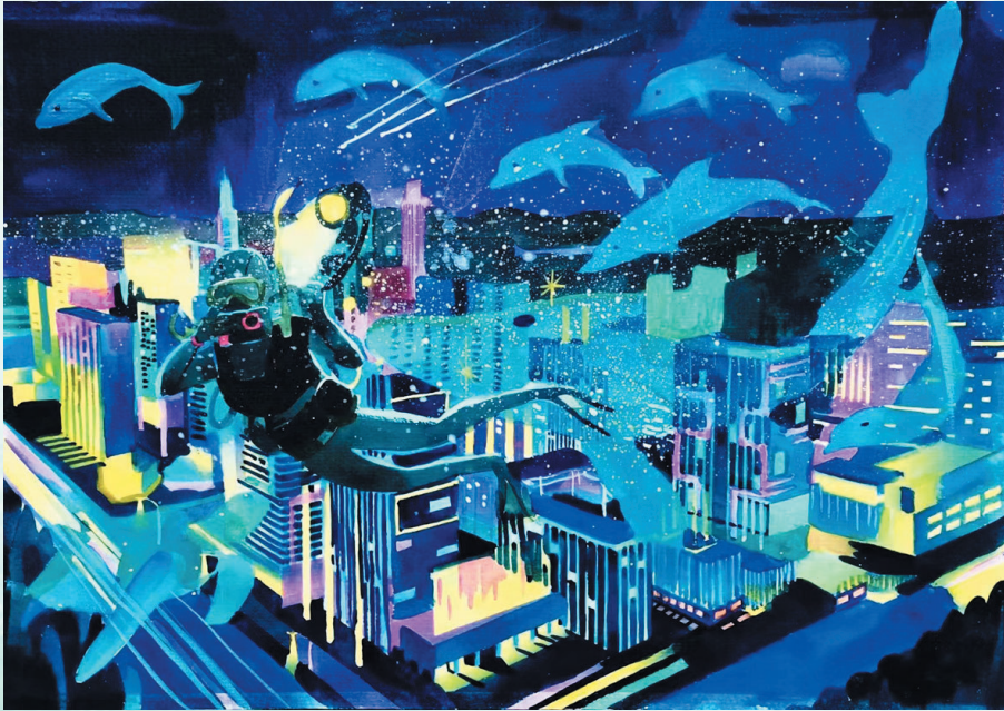
■《蔚蓝色的梦》 西海岸新区育才初级中学九年级 杜昊宸