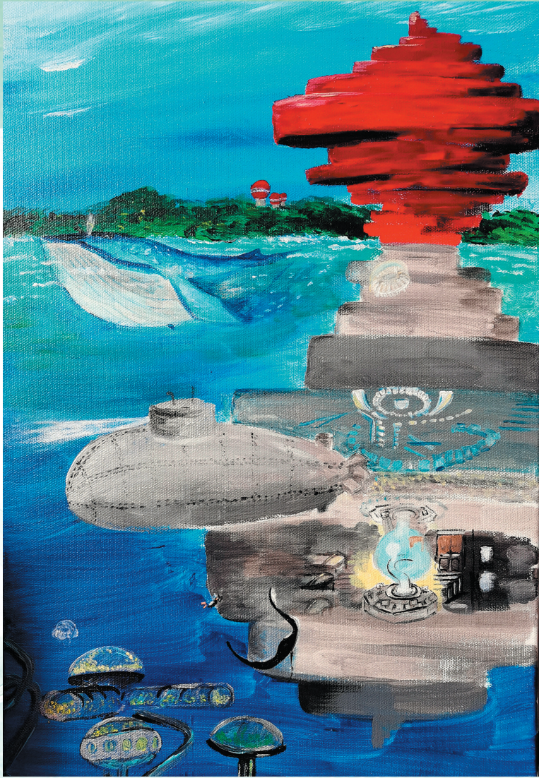
■《海底城市 青岛印象》 青岛第四实验初级中学七年级 苏子玉