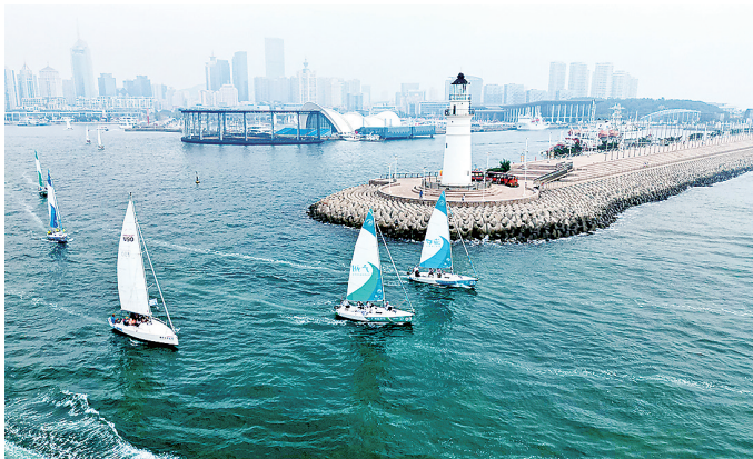
■青岛奥林匹克帆船中心白帆点点。