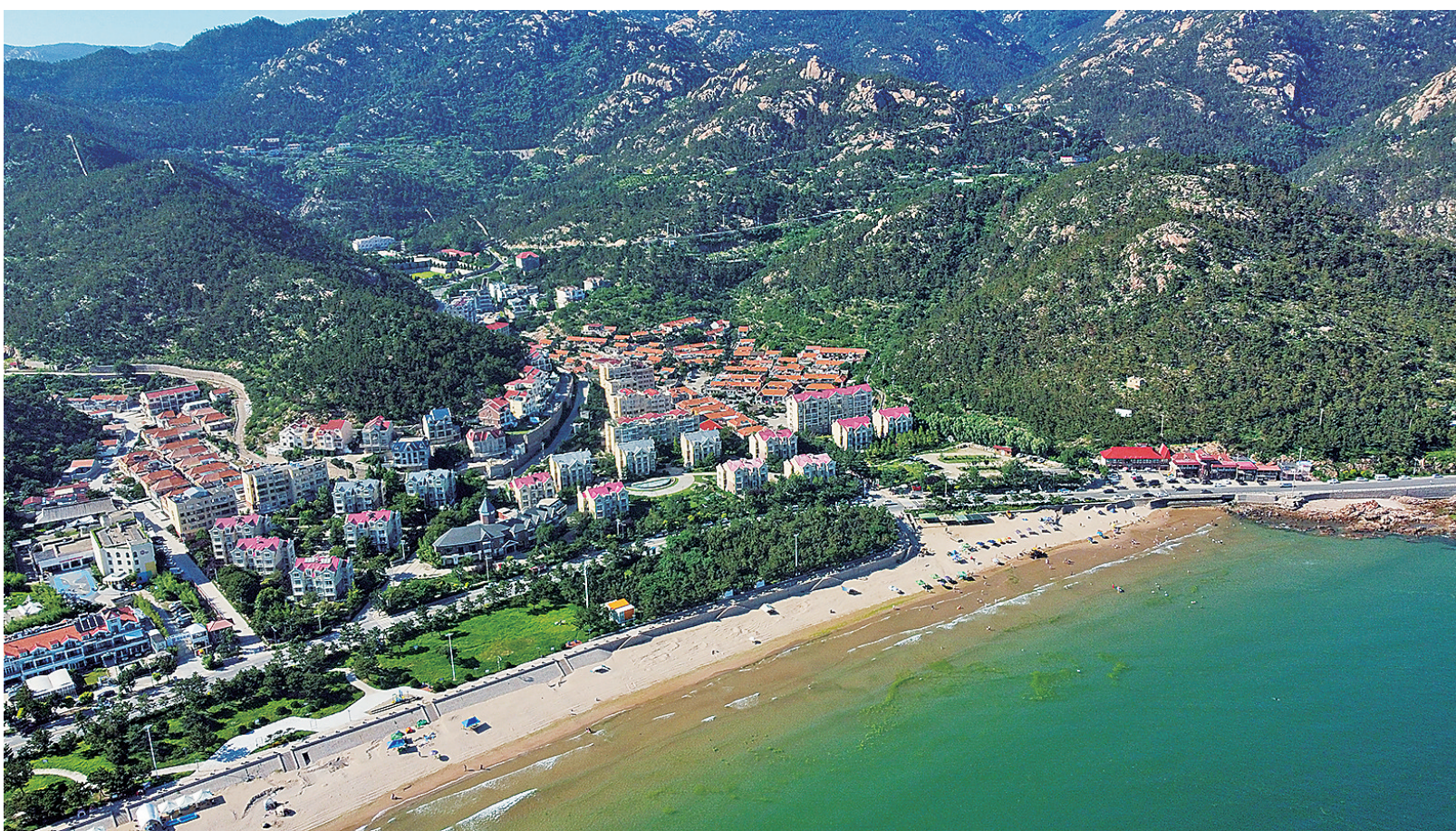
■全国乡村旅游重点村——崂山东麦窑。