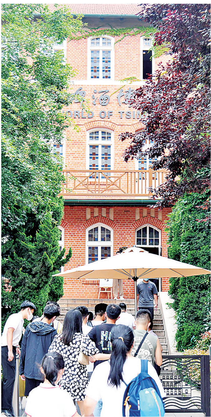
■青岛啤酒博物馆游人如织。