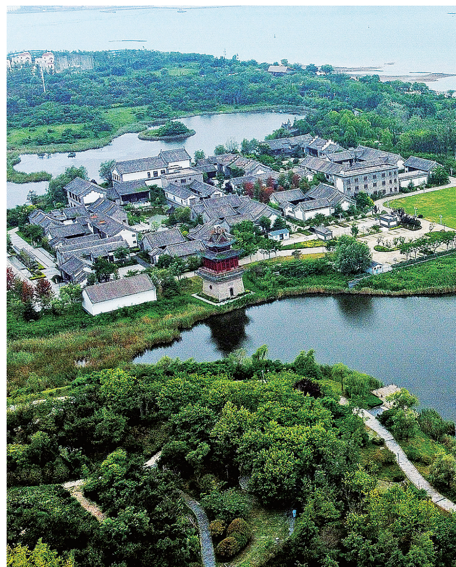
■郁郁葱葱的唐岛湾湿地公园。