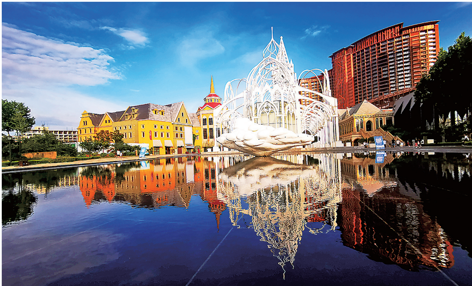
■夕阳下的青岛红树林度假世界。