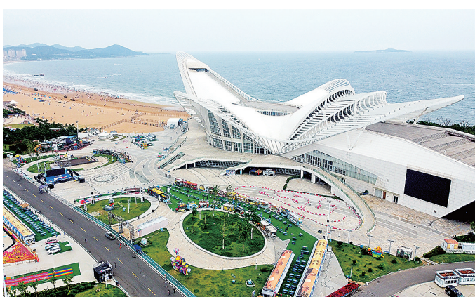
■凤凰岛金沙滩活力十足。