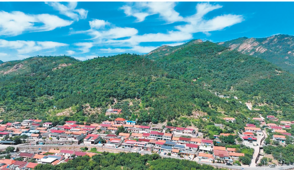
■被绿意环绕的上岵峪天高云淡,正是秋游好去处。

近日,山东省文化和旅游厅、山东省发展和改革委员会公布了2022年山东省乡村旅游重点村名单,拥有中国美丽休闲乡村、山东省旅游特色村、山东省景区化村庄等荣誉的上岵峪村再获殊荣。近年来,城阳区旅游发展中心不断推动以旅游为乡村赋能,一座座村庄山美、水美、情更美,让湾区都市活力之美在城乡间精彩绽放。