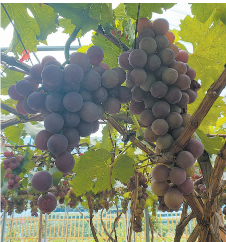
■成熟的葡萄挂在枝头,秋游采摘又到了好时候。