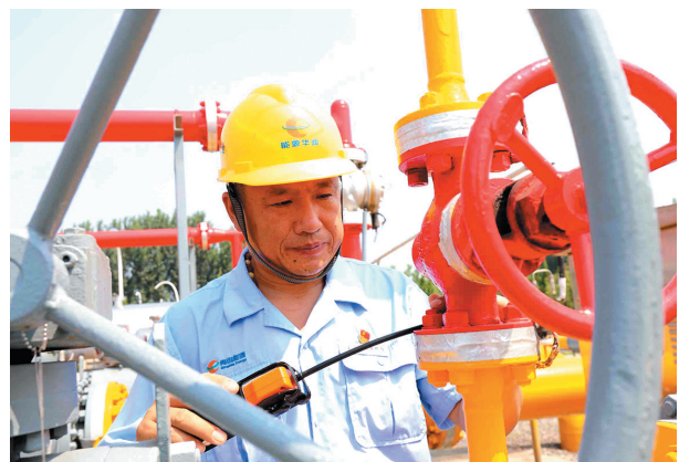
■燃气工作人员正在巡检管线。