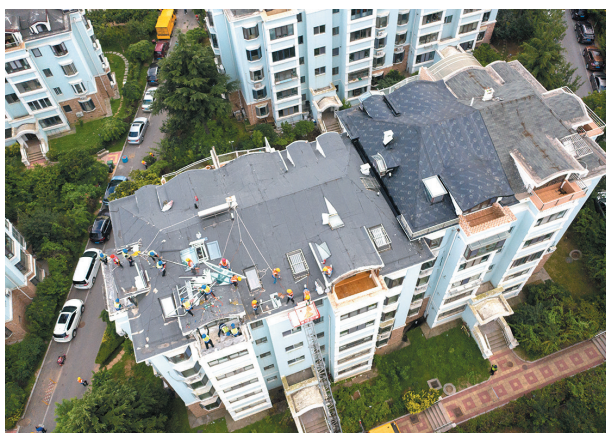
■崂山区建飞花园拆违现场。