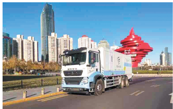
■环卫车辆对道路进行深度保洁。