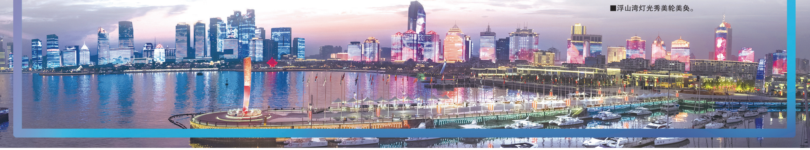
■浮山湾灯光秀美轮美奂。

加强城市管理制度改革,聚焦城市管理新情况新问题,推进高水平制度创新成果。年内出台加强城市精细化管理实施意见,为精细管理提供规范、科学、可操作的顶层指引。(贾 臻)