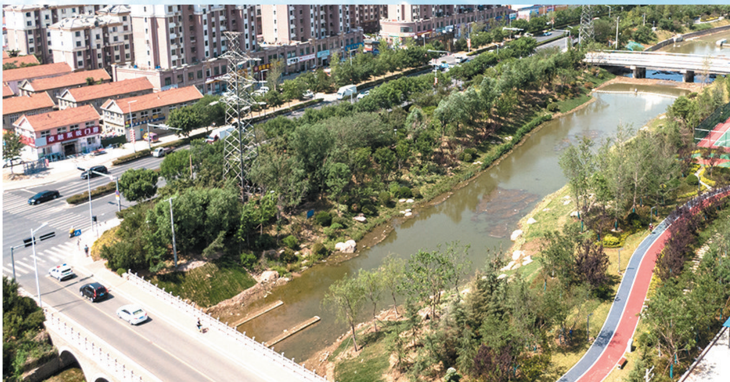
■城阳区 古庙工业园区 临近河道的 违建厂房变身休 闲公园。

今年以来,青岛市城市管理局全面落实省第十二次党代会、市第十三次党代会和市“两会”精神,紧紧围绕市委、市政府工作要求,以“作风能力提升年”活动为抓手,以城市更新和城市建设三年攻坚行动为契机,以全国文明典范城市创建为重点,坚持“走在前、开新局”,城市管理各项工作在真抓实干中展现新作为新担当。