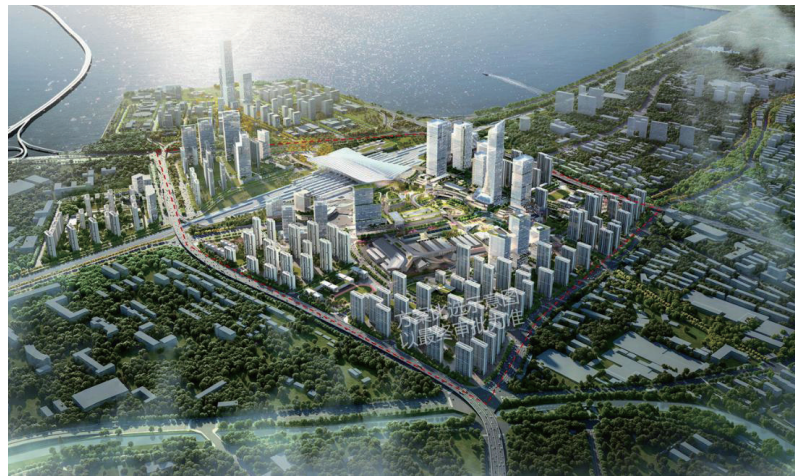
▲青岛TOD开发一号工程和低效片区利用重点工程——青岛创新创业活力区效果图。