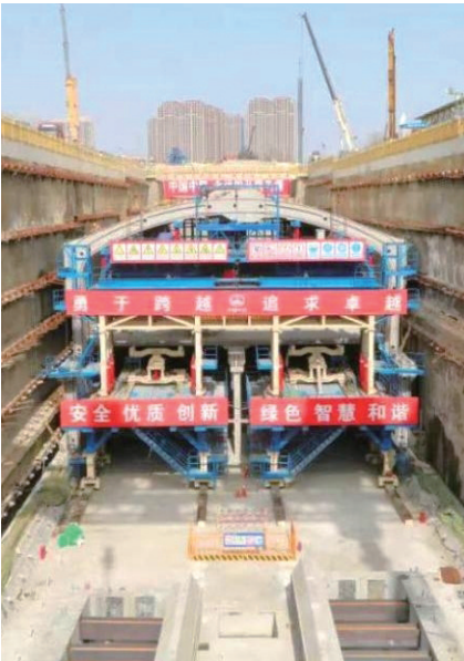
■青岛地铁6号线一期装配式车站（可洛石站）拼装现场。

“最聪明”地铁从青岛出发，跑到世界最前列。国家示范工程——列车自主运行系统（TACS）项目，是青岛地铁牵头中国中车、上海富欣、中兴高达，在自主创新领域的关键性技术突破，具有国际领先水平。目前，已完成6号线项目招标，一系列技术难题被攻破，正式进入工程应用阶段，将是国内第一条列车自主运行线路，具有完全自主知识产权。TACS技术的推广和示范应用，将极大提升“中国智造”在世界轨道交通领域的地位和影响力，为中国城市轨道交通装备“走出去”提供有力保障。