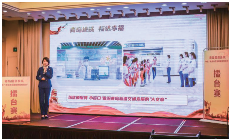
▲青岛地铁参加市国资系统争创“青岛市五星级党组织”擂台赛。