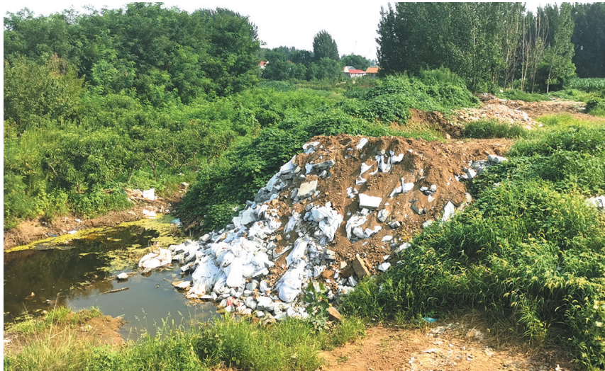
即墨区大信街道司家疃三村北侧河道被偷倒的建筑垃圾堵塞。