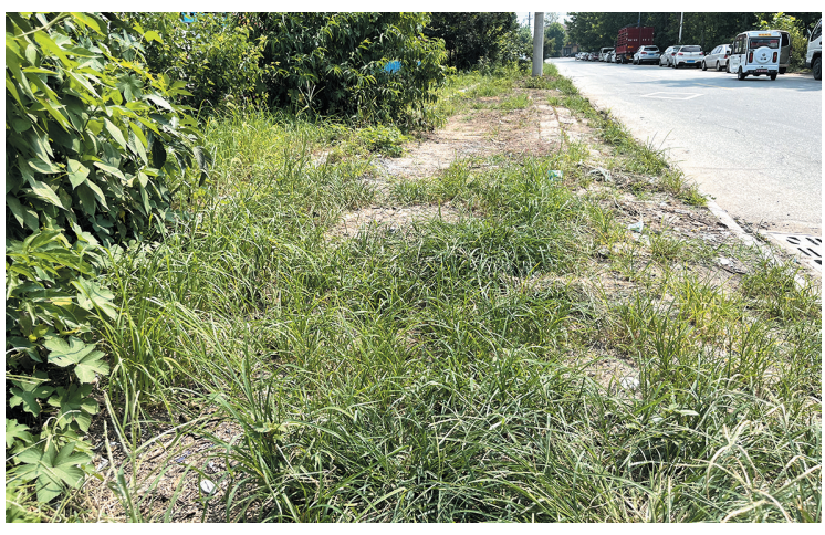
莱西市香江路人行道上杂草丛生。

记者观察发现,香江路北侧的人行道并不完整,仅在道路东半段的安居小区和沿街商户门前设有人行道。该处人行道长约200米,宽约2米,被茂盛的杂草掩盖,远看像一片草从。记者近处查看,在杂草比较稀疏的区域,一簇簇杂草从方形地砖的缝隙中长出,地砖碎裂,地面凹凸不平。记者在人行道上行走,高约30公分的杂草叶子划过小腿,带来明显的刺痒感。杂草掩盖之下,这一段人行道还有重重“陷阱”:一处污水井盖塌陷、动物粪便散落在