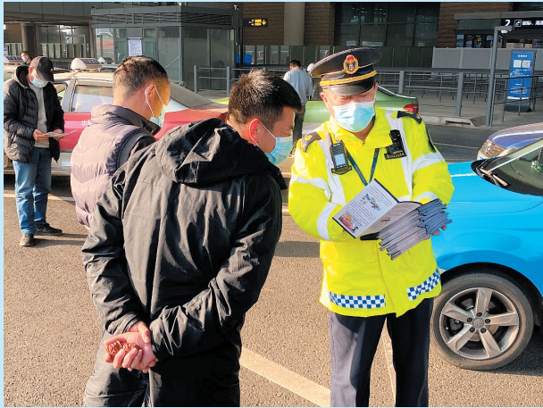
■胶州市政府:在胶东国际机场发放《致机场出租车驾驶员的一封信》等宣传材料。