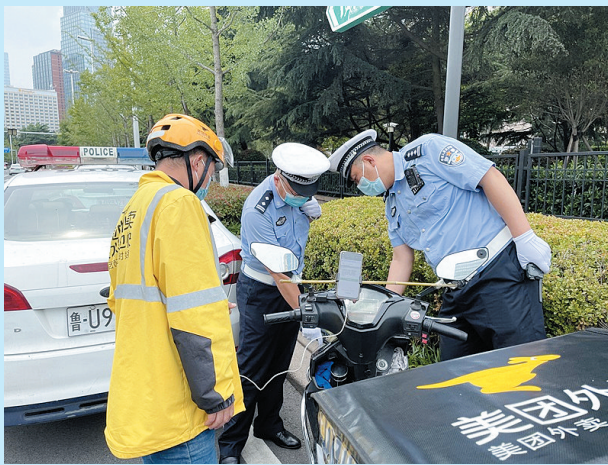
■市公安局:组织警力在重点时段重点区域集中开展专项整治。