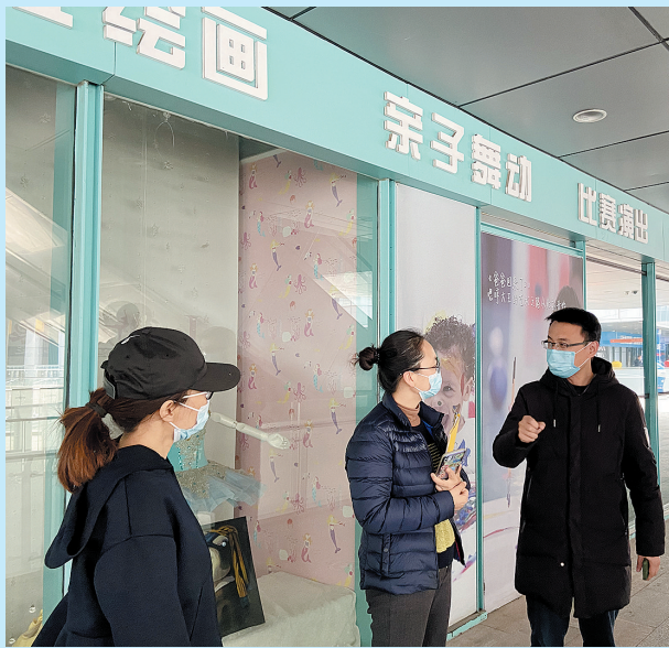
■市教育局:开展校外培训机构专项检查。