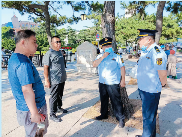
■市文化和旅游局:加大执法力度维护旅游市场秩序。