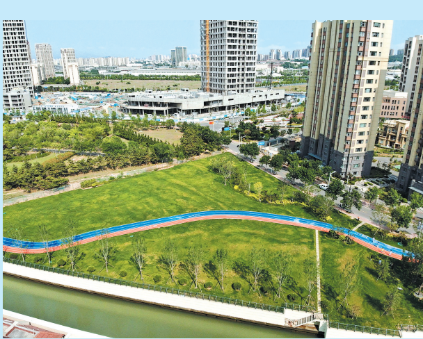
■市城市管理局:市北区瑞岛路违建拆除前(右图)后(上图)对比。

加大铁路青岛北站及胶东国际机场周边出租客运市场执法力度。铁路青岛北站方面,协调青岛火车站联管办建立联合执法机制,开展联合执法15次。累计查处出租汽