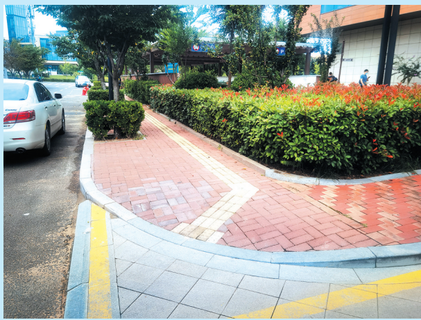
■市住房城乡建设局:改造后的李沧区响水路无障碍坡道。