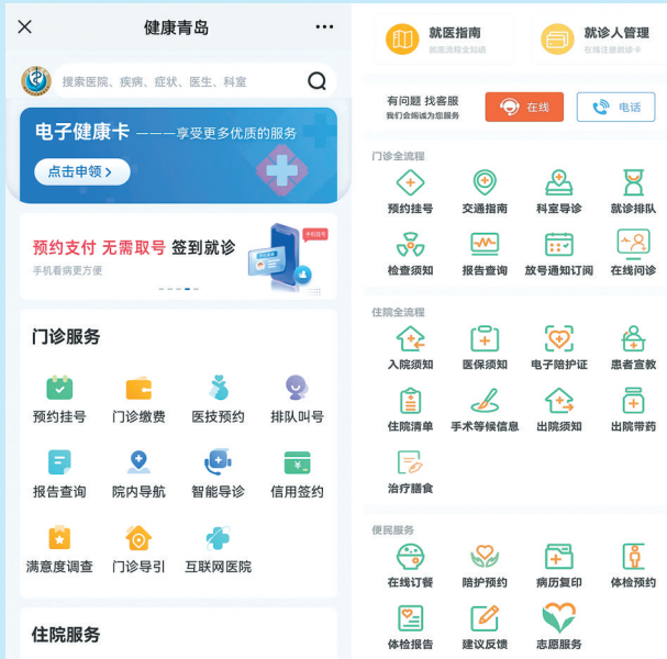
■市卫生健康委:一站式智慧服务平台。