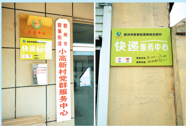
■市邮政管理局:行政村“快递服务中心”完成标准化建设。

车违法违规行为137起,将160余部重点嫌疑车辆录入青岛火车站周边区域智能监控系统,及时预警,精准查处。胶东国际机场方面,制定交通运营秩序集中整治方案,结合胶东半岛联合执法、全市同步执法工作,在胶东国际机场周边组织开展跨区域执法、同步执法11次,查处出租汽车违法违规行为32起,其中黑出租24部、出租车违章8起。