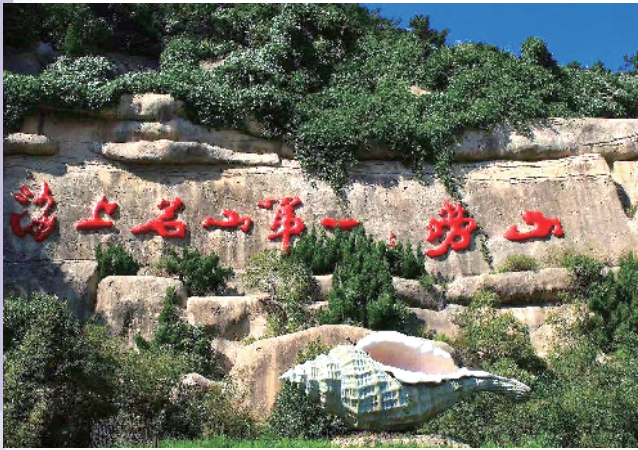
■“海上名山第一”是崂山的闪亮名片。