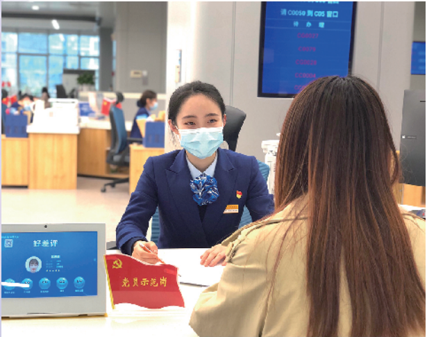
■“党员示范岗”为群众排忧解难。