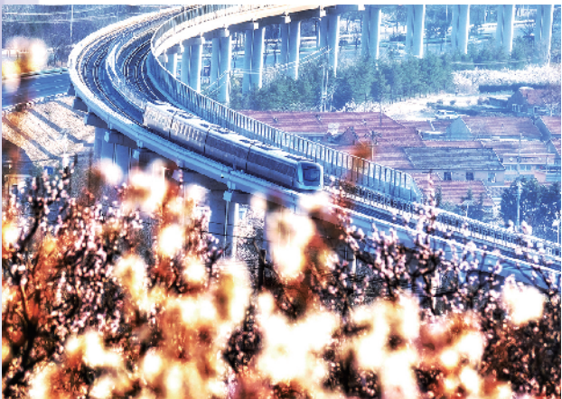
■最美青岛地铁11号线。