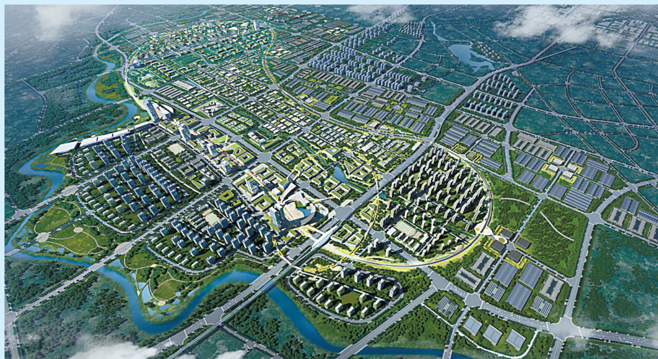
■中日(青島)地方发展合作示范区规划鸟瞰效果图。