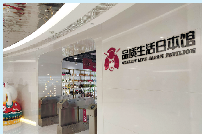
■位于中日韩消费专区电商体验中心的品质生活日本馆。

大连、上海、苏州、成都6个城市建设中日地方发展合作示范区,要求分别聚焦节能环保产业、健康产业、高端装备制造与新材料产业、新能源产业、智能制造产业、文化创意产业开展对日经济合作。