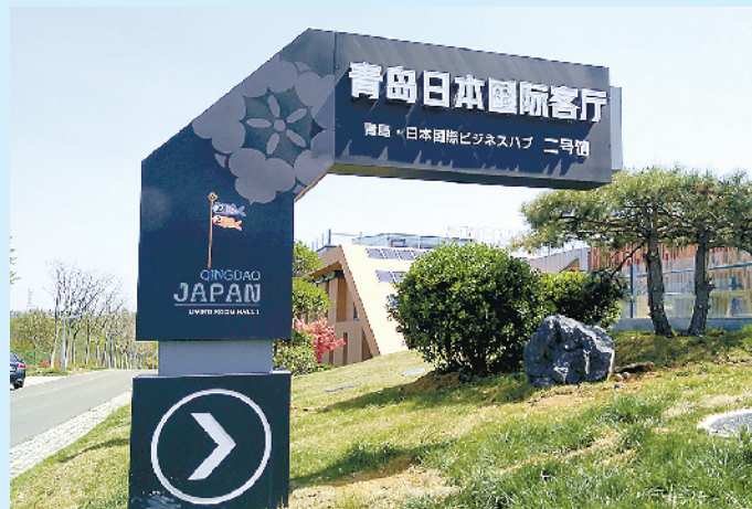
■青島日本国际客厅。