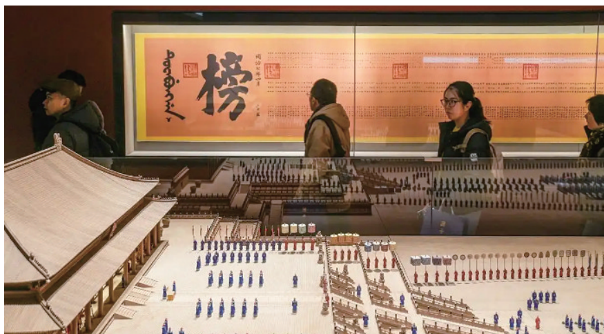
不久前,在孔庙和国子监博物馆举办了中国古代科举文化展。图为观众在同治七年的“金榜”复制品前驻足。

6月7日,全国一千多万学子走进高考考场。你是否了解,中国人对选拔人才的执念从何而来?答案,藏在一千三百年的科举历史里。从隋朝大业元年(605年)正式创立,到清朝光绪三十一年(1905年)废止,科举制度延续了整整一千三百年,共选拔出进士十余万人,举人、秀才数以百万计。