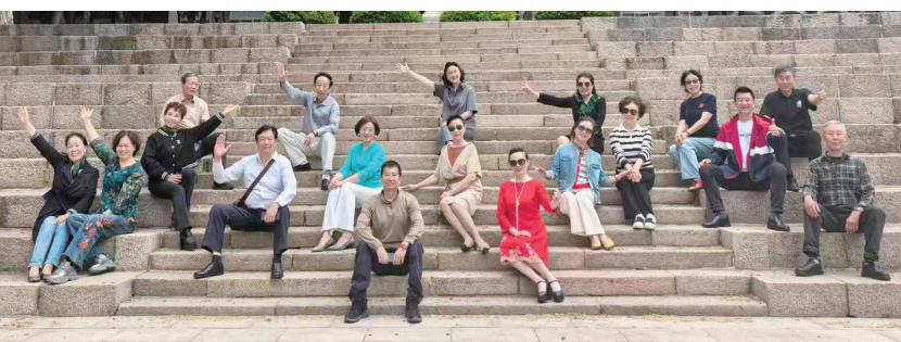
老教师模特艺术团的团员们在校园合影