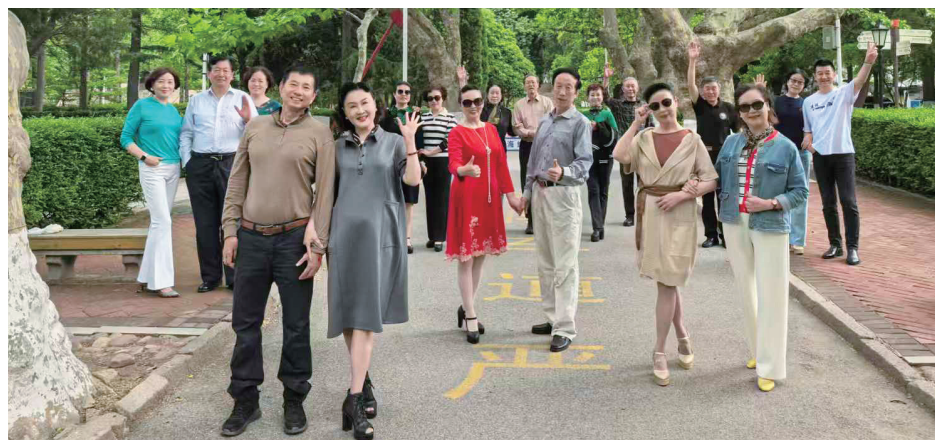
中国海洋大学老教师模特艺术团的团员们漫步在海大鱼山校区