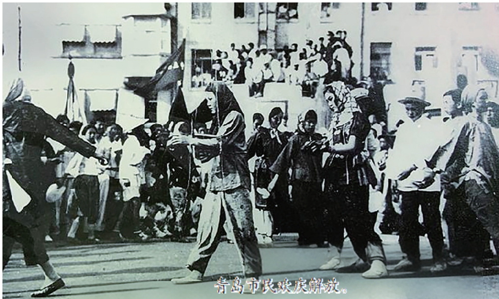
青岛市民欢庆解放。

1949年6月2日,青岛解放,青岛从此回到人民的怀抱。随之而来的接管工作,紧锣密鼓有序展开。