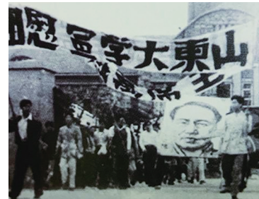
山大师生欢庆解放。

1948年6月10日,中共中央向各中央局、分局、野战军前委转发了《中共东北中央局关于保护新收复城市的指示》,为青岛的城市接收工作提供了指南和遵循。