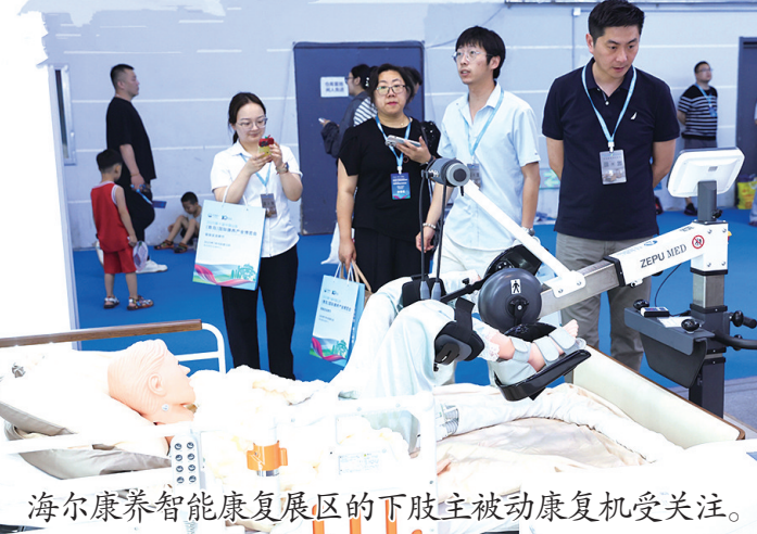
海尔康养智能康复展区的下肢主被动康复机受关注。