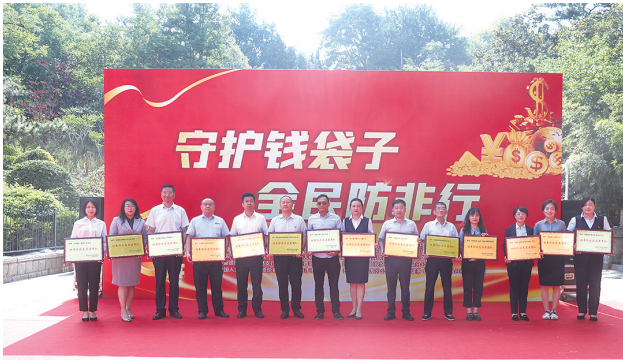
获评“优秀防非志愿者团队”称号的金融机构

本报讯 6月17日上午,在青岛市委金融办、青岛日报报业集团、市北区政府的共同指导下,市北区金融办联合公安市北分局、辽宁路街道、老年生活报,以及农行四方支行等14家金融机构,在贮水山公园共同开展“守护钱袋子 全民防非行”主题宣传活动。现场通过文艺汇演、倡议发布、授牌表彰等形式,向市民普及防非知识,提升金融风险防范意识。