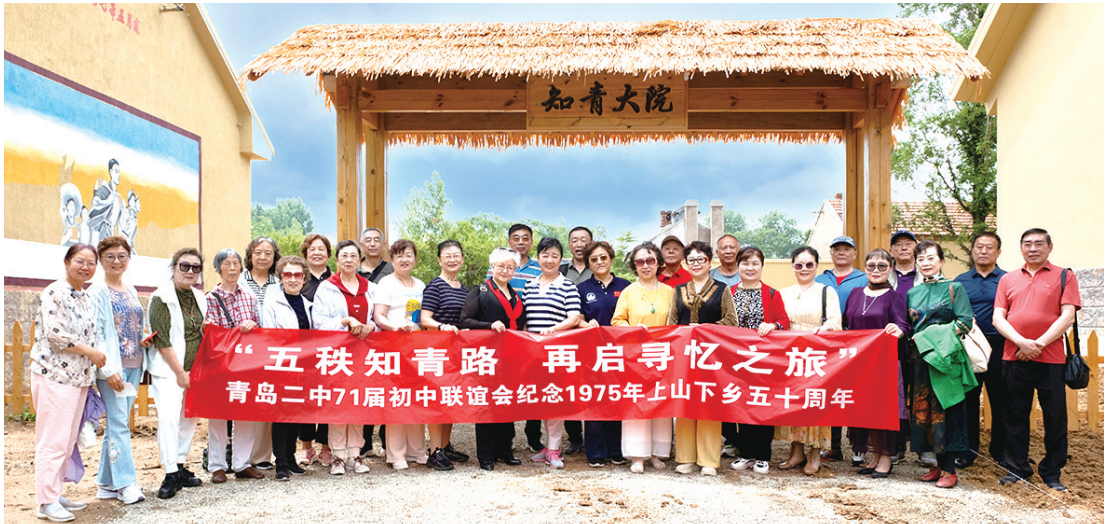
参加青岛二中71届初中联谊会的同学们在知青大院门前合影。

6月15日,在欢声笑语中,青岛二中71届初中联谊会的三十余名同学齐聚一堂,共赴“青岛美丽乡村”——青岛西海岸新区张家楼街道大洋村。此次行程,为了纪念他们于1975年参加的上山下乡运动五十周年。