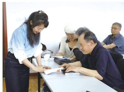
▲ 学员们翻阅之前完成的回忆录作品。