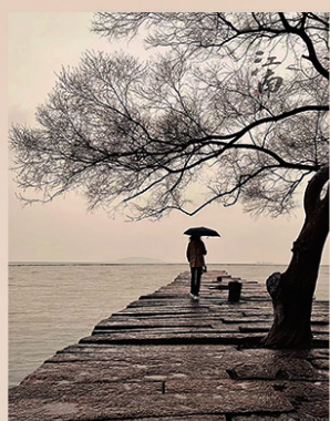
鞠浩海 《又是江南烟雨时》