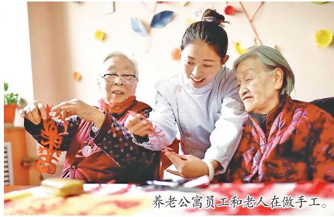
养老公寓员工和老人在做手工。

为加快建立完善养老金融体系,全力做好养老金融大文章,中国人民银行、金融监管总局、国家发展改革委、民政部、财政部、人力资源社会保障部、国家卫生健康委、中国证监会、国家医保局等九部门近日联合印发《关于金融支