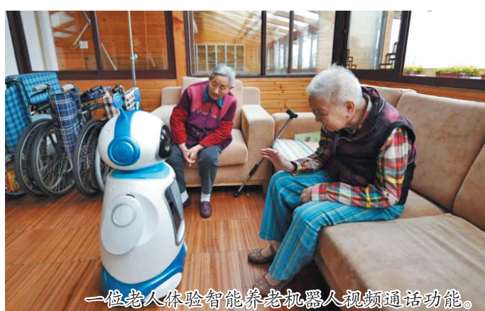
一位老人体验智能养老机器人视频通话功能。

智慧养老企业推动着“康养”产业的发展壮大。60岁以上老年人康养诉求是多方面的，需要专业家庭医生、护士及护理人员提供服务，同时也需要亲友的情感关照。子女难以一人身兼多职。