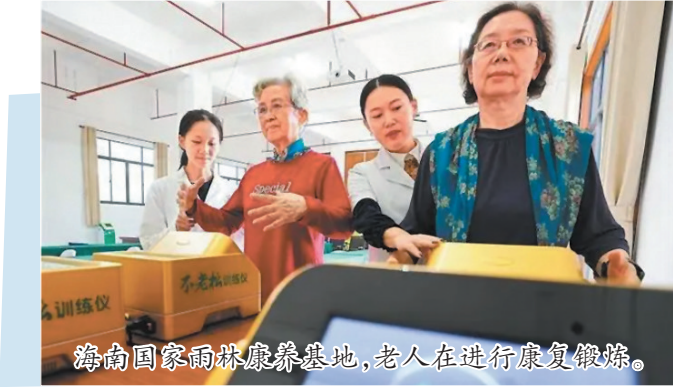
海南国家雨林康养基地,老人在进行康复锻炼。

如今,社会鼓励孩子表达自我、探索未知,孩子们得到了更多发挥潜能的机会。有“小孩哥”11岁能造“火箭”,有“小孩姐”14岁创下奥运纪录。他们年纪虽小,却拥有非凡才能,成年人自叹不如,便在“小孩”后加上“哥/姐”称呼他们。“小孩哥/小孩姐”便成