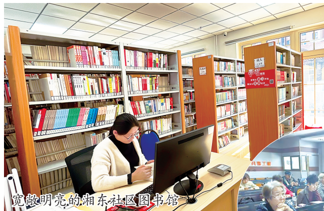
宽敞明亮的湘东社区图书馆

“活到老,学到老”,阅读对于老年人享受晚年生活的重要性不言而喻。近日,民政部、中国老龄协会等14部门联合印发了《关于推进老年阅读工作的指导意见》,各地也积极响应,采取多种措施为老年人阅读提供便利和支持。记者近日走访了部分图书馆和社区书房,深切感受到老年人对知识的渴望与追求。