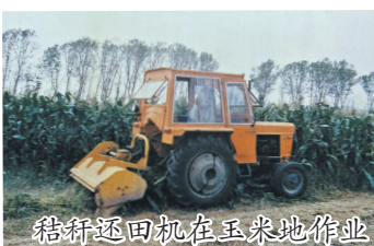
秸秆还田机在玉米地作业