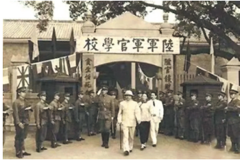
孙中山视察黄埔军校

1924年6月16日,在广州黄埔岛上,“陆军军官学校”(又称“黄埔军校”)举行开学典礼。黄埔军校是第一次国共合作的重要产物和重要见证,从筹建学校、招生到开学初的各项工作,处处可见共产党人的积极参与。