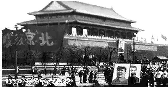
1950年劳动节首都游行

4月28日,刘少奇将自己在全国政协纪念五一国际劳动节干部大会上的讲话稿送毛泽东审阅。毛泽东对讲稿作了认真修改,并于4月29日早上5时给刘少奇回信予以说明,信中说:“修改的主要点如下:不要说‘今年是困难的最后一年’,因今后几年内都会有困难,而且仍将是相当严重的困难,不过将一年一年地减少罢了。其他说到困难‘很快就可以过