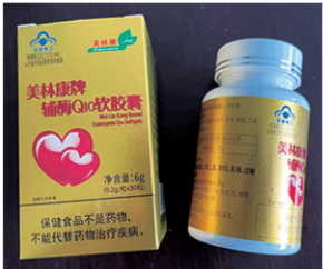
威海紫光科技有限公司 国食健字G202137101442 鲁食健广审(文)第240525-01062号 本品不能代替药物

活动要求:为了让实惠真正落到需要的读者身上,本次活动提出以下两点要求:①团购者必须是真正有需求的朋友;②为防止恶意囤货,每人最多购买2份。