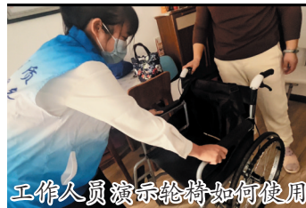
工作人员演示轮椅如何使用