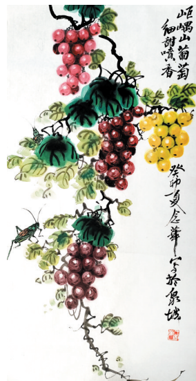
国画《葡萄图》 王念华