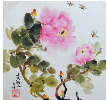
国画《采蜜忙》 尹巨生