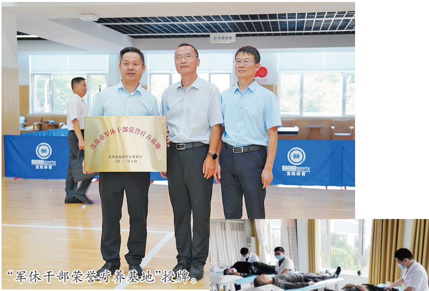
“军休干部荣誉疗养基地”授牌。

年轻时他们是并肩作战的战友,见证彼此的青春岁月;中年时他们是共同奋斗的同事,见证了彼此的成家立业;现在是亲密无间的邻居,一起抱团养老。“感谢党和政府给我们找了这样一个好地方,让我们可以安享晚年。”军休老人说。日前,青岛莱西市宏远健康颐养中心评选为“军休干部荣誉疗养基地”,让军休老人老有所养、老有所医、老有所乐是国家和社会的共同责任。