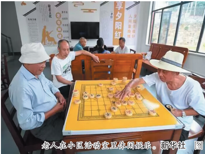
老人在小区活动室里休闲娱乐。

小区活动中心是业主共同拥有的公共设施,不得擅自改变其用途。政府有关部门有权对其进行合理的调整和管理,并在必要时进行改建和改造。但在进行改变用途前,也需要向业主委员会或其他管理组织进行沟通 and 征求意见,以便尽可能地维护业主的利益和权益。