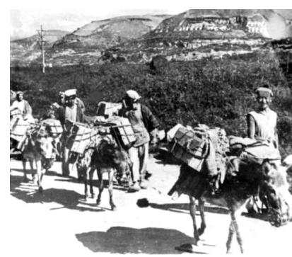
▲ 陕甘宁边区群众为部队运送弹药