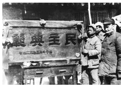
▲ 八路军留守兵团给陕甘宁边区政府赠“民主典范”匾