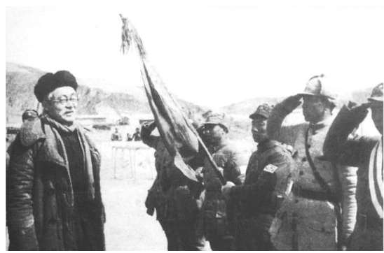
▲ 1943年3月,林伯渠率领边区党政慰劳团慰问南泥湾驻军

展开。 1943年10月1日,中共中央发出《关于减租、生产、拥政爱民及宣传十大政策的指示》,明确指出“各根据地党委和军政领导机关,应准备于明年阴历正月普遍地、无例外地举行一次拥政爱民和拥军优抗的广大规模的群众运动”“以后应于每年正月普遍举行一次”。自此,双拥运动在各根据地逐步开展起来,并成为我党我军的优良传统。古树文