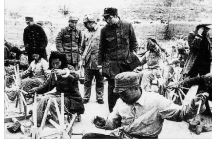
▲ 留守兵团司令员肖劲光(戴眼镜者)查看部队生产