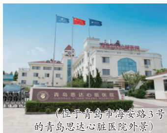
(位于青岛市海安路3号的青岛思达心脏医院外景)