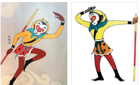
孙悟空动画形象最终稿