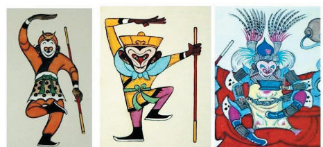
孙悟空动画形象最初设计稿