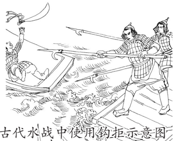
古代水战中使用钩拒示意图

齐国尽管有内乱,但面对吴国的强大攻势,齐国内部暂时摒弃前嫌,同心协力保卫家园。琅琊海战中,齐国水军先使用火箭攻击吴军战船,之后利用金属冲角和钩拒对吴军战船进行撞击围困。吴国水军难以抵挡,损失惨重,仅有部分残兵突出重围。主将徐承在部将保护下杀出重围,狼狽