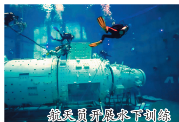
航天员开展水下训练

近期,我国启动了第四批预备航天员的选拔工作,以满足载人航天工程后续飞行任务需求。此次将选拔12~14名预备航天员,包括航天驾驶员、航天飞行工程师和载荷专家3种类型。其中,载荷专家将首次在港澳地区选拔。那么航天员分类为何越来越多?他们的工作任务和选拔训练要求有哪些异同?