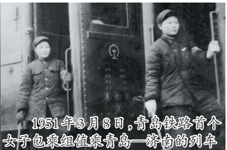
1951年3月8日,青岛铁路首个女子包乘组值乘青岛-济南的列车

1951年3月8日6时,青岛铁路分局和青岛市妇女界在青岛站召开大会,热烈庆祝青岛铁路第一个女子包乘组(即“三八妇女包乘组”)诞生,正式值乘济南-青岛间167/168次普客列车。当晚,女子包乘组第一次值