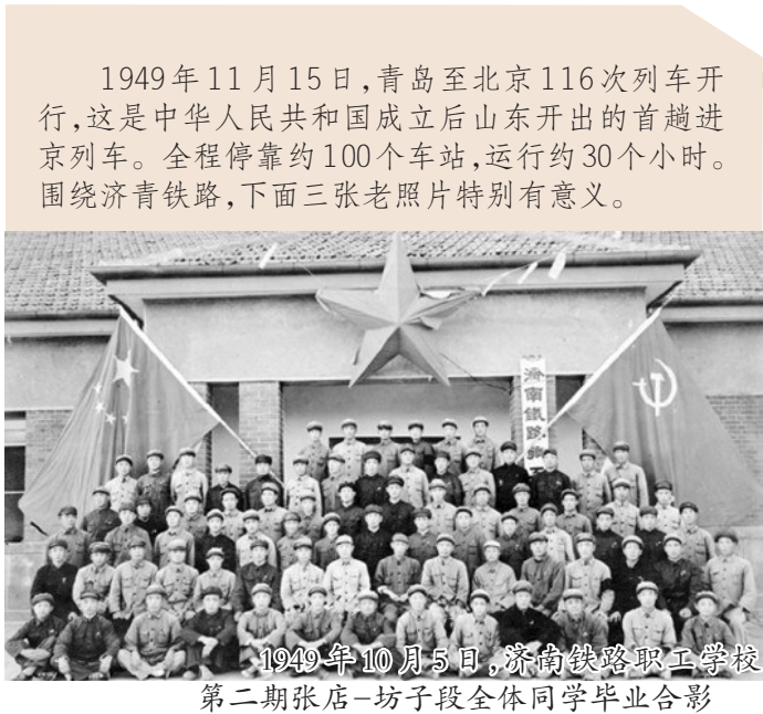
1949年11月15日,青岛至北京116次列车开行,这是中华人民共和国成立后山东开出的首趟进京列车。全程停靠约100个车站,运行约30个小时。围绕济青铁路,下面三张老照片特别有意义。