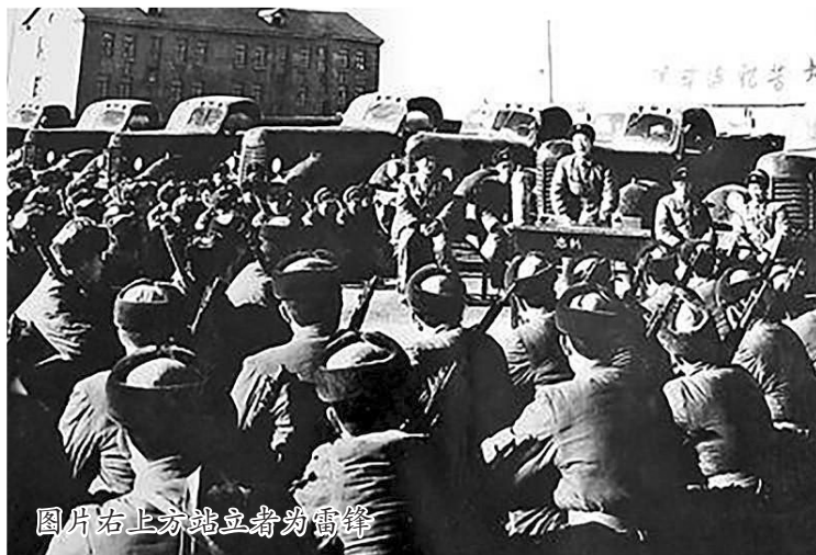
图片右上方站立者为雷锋