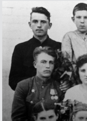
上世纪40年代,戈尔巴乔夫(后排左一)与同学们的合影。