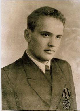
戴着劳动红旗勋章的戈尔巴乔夫,这是他在俄罗斯南部平原驾驶联合收割机时获得的。