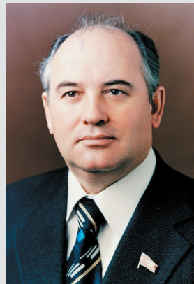
1984年2月20日,在莫斯科,第二年,他当选为苏共最高领导人。