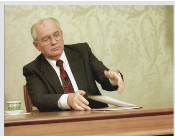
1991年12月25日,莫斯科,戈尔巴乔夫在克里姆林宫通过电视发表辞职演说后整理桌子。

8月30日,苏联最后一任领导人戈尔巴乔夫当天晚上因长期重病医治无效去世,终年91岁。戈尔巴乔夫在苏联最后一任最高领导人位置上,尝试了对苏联体制的最后改革,见证了东欧巨变和苏联作为超级大国的解体。在当时历史发出巨大轰鸣的时刻,戈尔巴乔夫正站在中心位置,对于冷战结束的方式和走向发挥了关键作用。