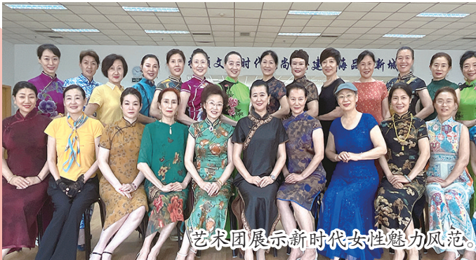
艺术团展示新时代女性魅力风范。