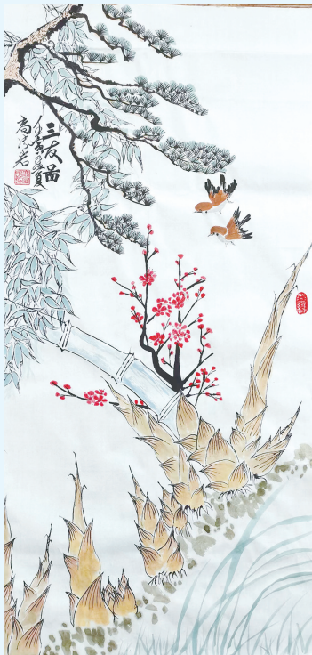
国画《孟夏》高凤岩 青岛市军休服务中心