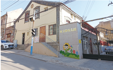
仅存的议事厅现状