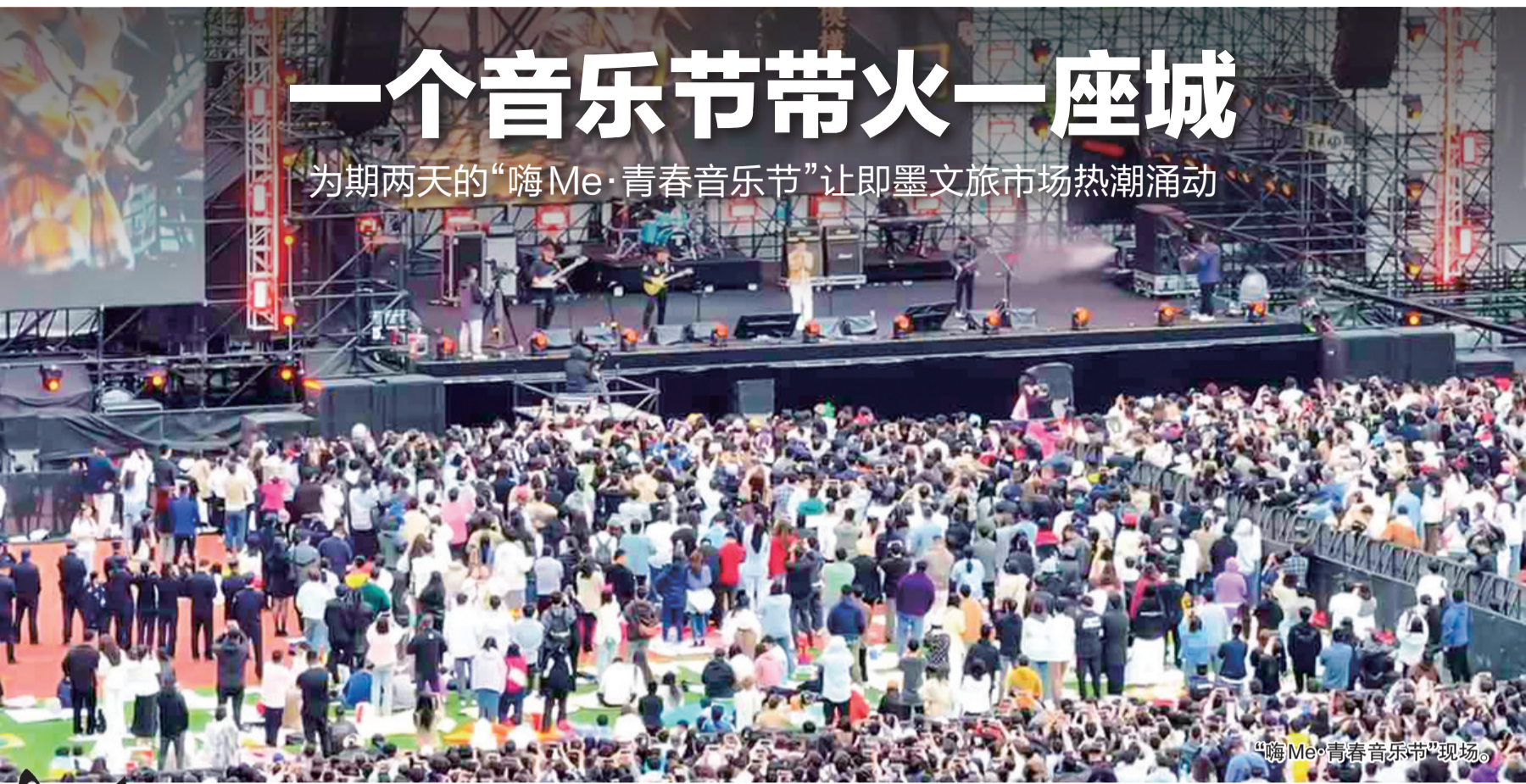
“嗨Me·青春音乐节”现场。