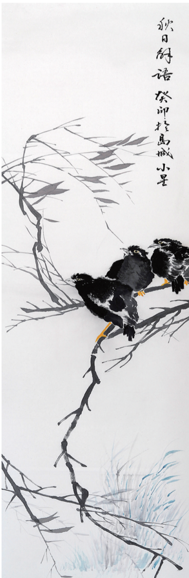
绘画 周小星 67岁 市老年大学