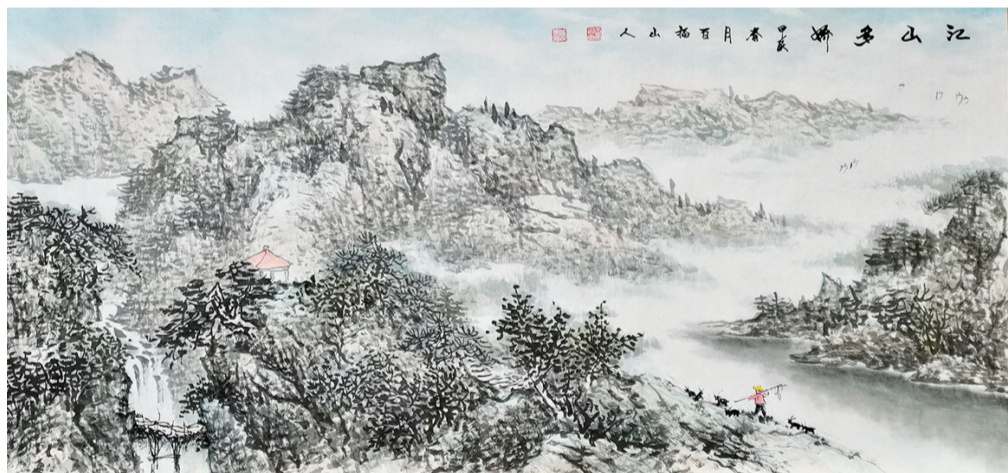
绘画 玉崇钢 74岁