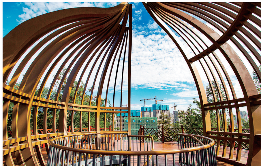
摄影《建设家园》宋亚民 73岁 市老年大学