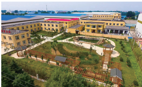
胶州美邻养老院外景。

在春暖花开的季节,漫步在百花丛中,欣赏着美丽的孔雀开屏,还可以在池塘边投喂水中锦鲤,如此惬意的养老生活着实让人羡慕,这其实就是胶州美邻