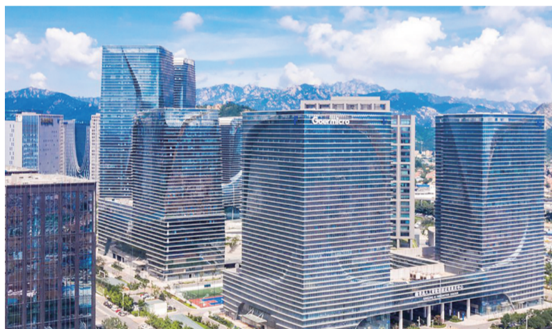
位于崂山区的歌尔微电子总部。资料图片