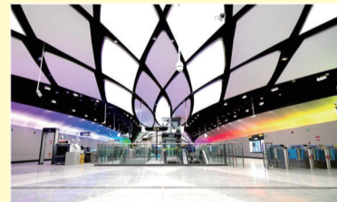
辛屯站:以“凤凰影城、灿烂的阳光”为设计关键词,站内扶梯利用光线和视错觉形成视觉时光隧道,站厅内天花板如阳光折射般绚丽夺目,闪烁着镌刻时光的痕迹。