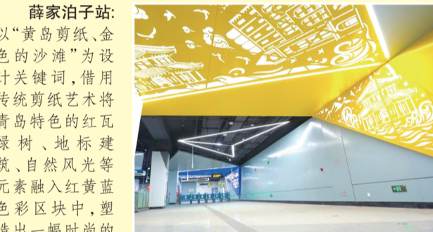
薛家泊子站:以“黄岛剪纸、金色的沙滩”为设计关键词,借用传统剪纸艺术将青岛特色的红瓦绿树、地标建筑、自然风光等元素融入红黄蓝色区域中,塑造出一幅时尚的城市剪影。