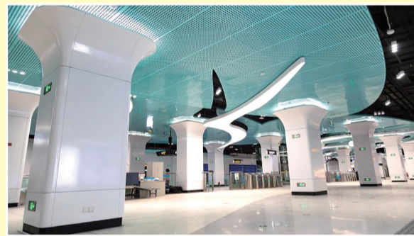
扒山(滨海学院)站:车站以“翱翔的海鸥、马濠运河”为设计关键词,站厅蔚蓝顶板配合墙边光带,犹如海鸥嬉戏运河两岸,营造开放、通联的空间意境。