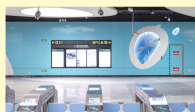
港头站:以“蔚蓝的大海、长城国防”为设计关键词,蓝白相间的主题色一秒将人拉入海底世界,站厅墙体内嵌椭圆形3D立体画,仿佛交织着海洋的回响。