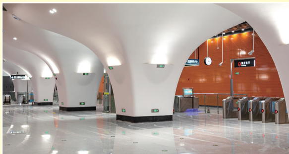
山王河(福莱社区)站:以“品牌企业、沁人心脾的啤酒”为设计关键词,利用抽象线条语言,用视错觉传递车站的工业感、线条感、场景感、畅快感,塑造轻快时尚的空间意境。